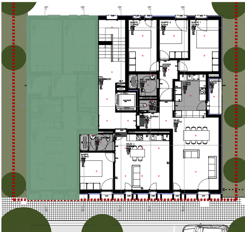
PLANTA PISO 2 - PROPOSTA